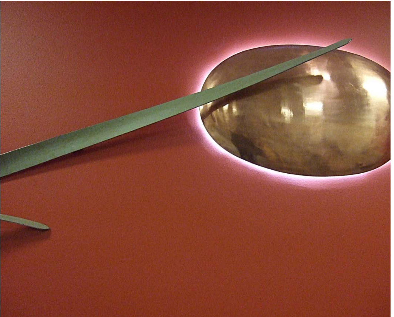
”Strandgräs och augustimåne” av Liss Annika Söderström

Konst till ortopedmottagningen K 52, Karolinska Universitetssjukhuset Huddinge