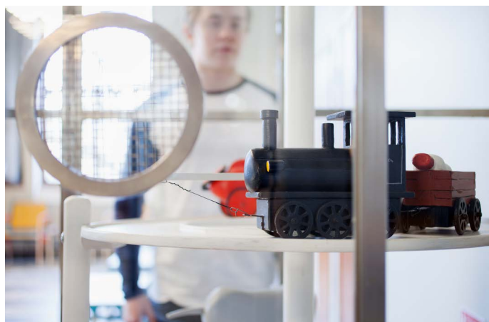
Detalj Mekanisk leksaksskulptur © Göran Hägg/BUS 2016