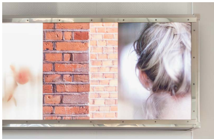
Detalj 8 + 3 Box Room