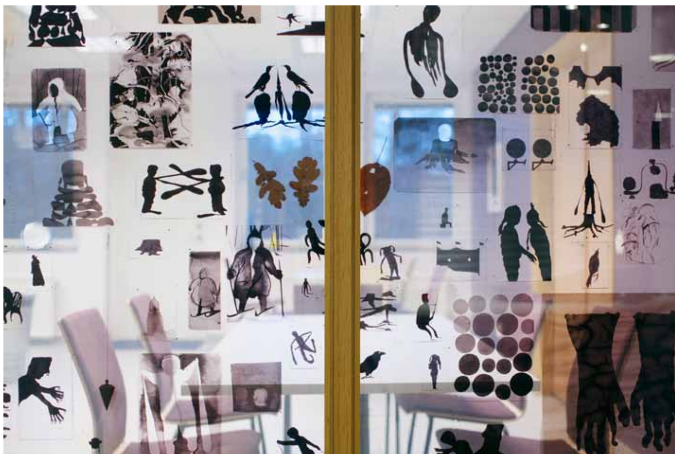
Kollektor, fotografier laminerade på glas av Dan Wirén

Konstnärlig utsmyckning på MotVikt, byggnad 02, plan 1 Danderyds sjukhus