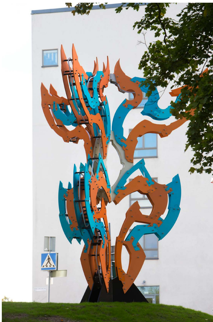
Kurbits , Pontus Ersbacken/BUS 2014.

Kurbits , en sex meter hög skulptur av Pontus Ersbacken placerad utanför entrén, skänker en egen identitet till byggnaden och är väl synlig i området. Konstverket kan ses som livets träd, ett fornnordiskt Yggdrasil med växandets kraft, men det associerar också till den moderna tidens dataspelsfigurer och robotar. Titeln anger att konstverket även är inspirerat av Dalar-nas kurbitstradition med dess slingrande växtdetaljer och starka färger. Hela konstruktionen är sammansatt av drygt 110 pusselbitar av eloxerad aluminium. Skulpturen belyses inifrån med en led-kabel som programmeras och kan lysa i en mängd olika nyanser efter mörkrets inbrott.