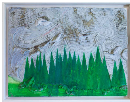
VäderLekar , Thomas Henriksson/BUS 2014.

Konstverken av Katrin Korfmann på vårdavdelningarna på plan 2 och 3 visar olika platser i världen och skildrar människor i rörelse. Bilderna som tycks skildra ett ögonblick är i själva verket resultatet av en serie bilder tagna under lång tid, från en lyftkran, eller med fjärrkontroll till en högt placerad kamera. Bilderna framstår via bearbetning som ögonblicksbilder av det vardagliga stadslivet på gatan, på marknaden, eller en högtidlig examen vid det anrika universitetet i Cambridge. Två kulturer samsas på varje våningsplan. Cambridge och Shanghai på plan 2 och Vrindavan och New York på plan 3.