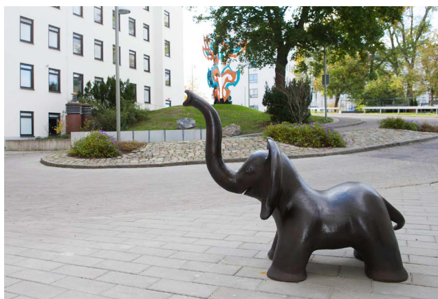
Elefantungen , Göran Hägg /BUS 2014.

Fyra konstnärer har utfört gestaltningar till byggnaden såväl utomhus som inomhus. Dessutom har bland annat entrén, patientrum och publika utrymmen på hotellet försetts med fotografi, måleri, collage, ljuslådor och skulptur av andra konstnärer.