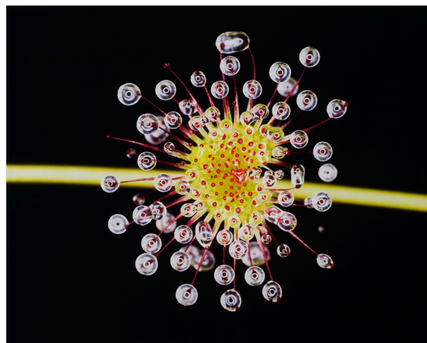
Drosea Stoloniifera