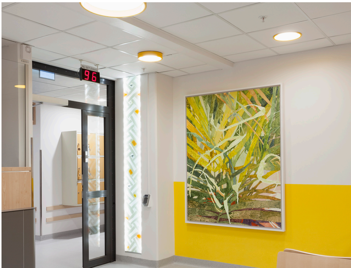
Flätverk med fåglar, Pi Eriksson/BUS 2015. Houseplant, Fredrik Åkum/BUS 2015

Södersjukhuset, byggnad 48, ASA Arbetsterapi och fysioterapi