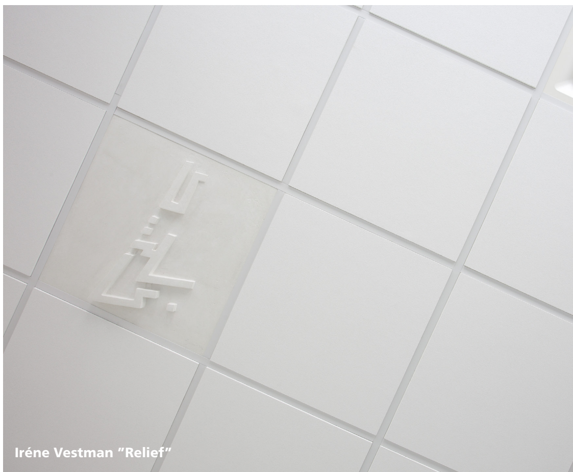
Iréne Vestman "Relief"