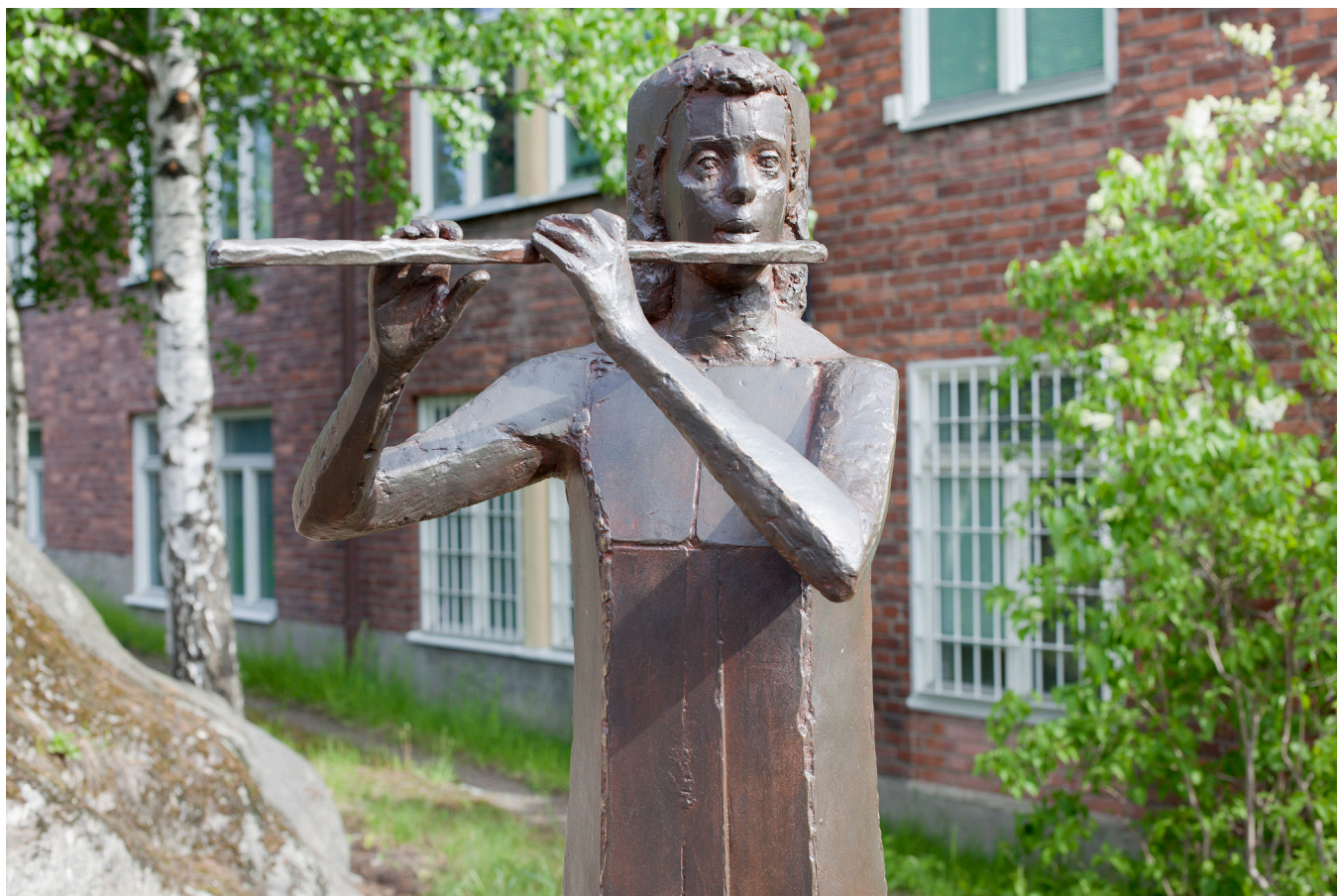
© Thomas Qvarsebo/BUS 2010, bronskulptur "Flöjtspelerska"

Neuroradiologiska kliniken, MR Centrum Karolinska Universitetssjukhuset Solna