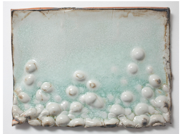
© Hanna Järlehed Hyving/BUS 2010, "Skivor"